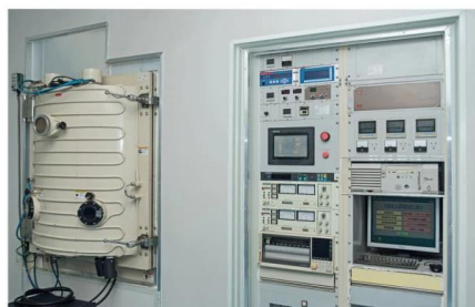
Carmanhaas Coating Machine