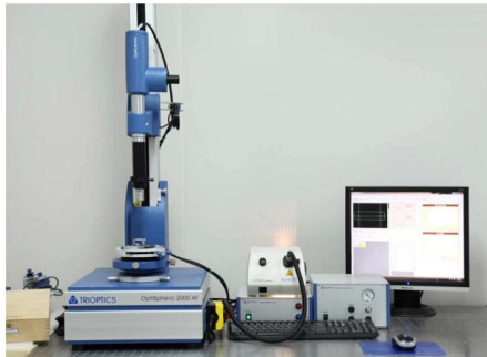
TRIOPTICS OptiSpheric 2000 AF ---Testing EFL, R, Centering Error, Wedge Angle, BFL, MTF