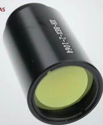
YAG Beam Expander