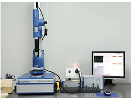
TRIOPTICS OptiSpheric 2000 AF ---Testing EFL. R. Centering Error. Wedge Angle. BFL. MTF