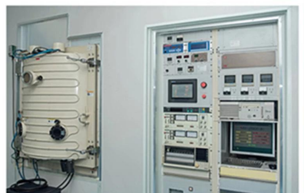
Carmanhaas Coating Machine