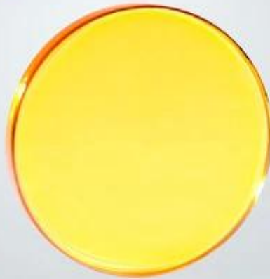
CO2 Beam Combiner