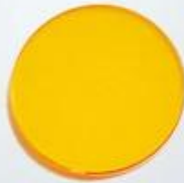
CO2 Beam Combiner