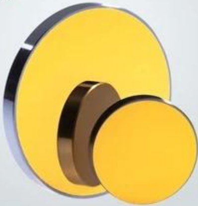
SI Reflector Mirror