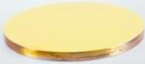
SI Reflector Mirror