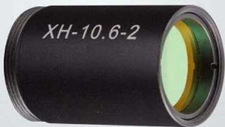
CO2 beam expander