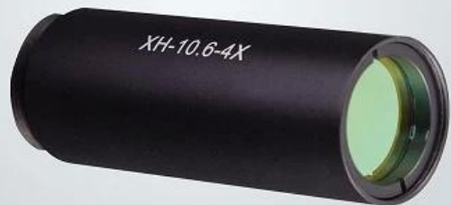
CO2 beam expander