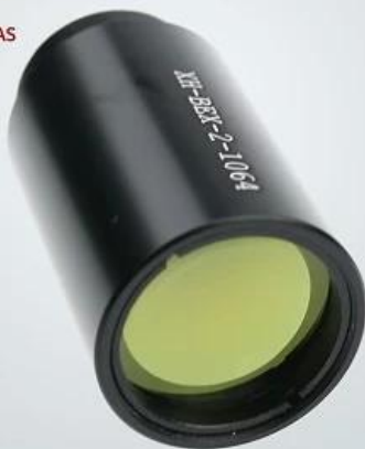
YAG Beam Expander