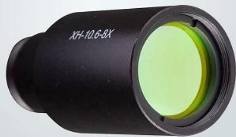
CO2 beam expander