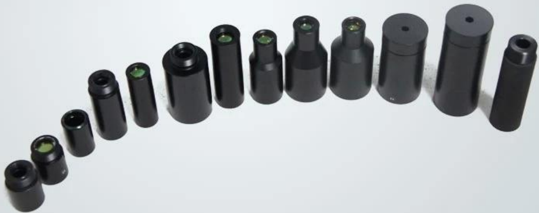
CO2 beam expander