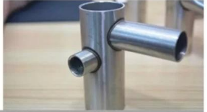
360 degree no dead seam weld