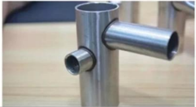
360 degree no dead seam weld